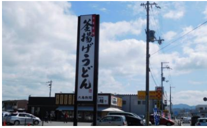
うどん県の人気に感動