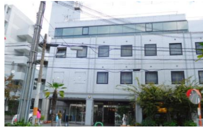
茨木セントラルホテル

7時37分の茨木発の快速電車で京都に向かう。途中、高槻で新快速に乗り換える。京都で下車し、1階の中央口のコインロッカーで荷物を預け、再度、山陰本線のホームに向かう。数分の待ち合わせで、京都発8時14分発の園部行きに間に合う。次の園部行きは8時44分だった。そして園部駅へ。車内は結構込んでいた。しかし、嵯峨嵐山からは乗客が大幅に減り、更に亀岡駅を過ぎると、一層少なくなる。この山陰本線に乗るのは、本年7月の数物同窓会以来、2度目である。ダイヤも10分～15分間隔で運行しているとは。また、京都圏の大きな足になっているとは。私が下宿していた先の太秦に駅も新たにでき、充実振りには驚いた。嵯峨嵐山から、園部まで車内の窓から、真剣に観察する。嵯峨嵐山から保津峡までトンネル。そして、保津峡から馬堀までまたトンネル。それ故、車内からは鉄道に沿った道は見当たらなかった。しかし、勘違いしてトロッコ列車の走る線路を道路と見なす。馬堀からは国道9号線から上桂経由で大きく回り込むしかないことを、並河駅の観光案内板で知ることになる。馬堀から園部までは、鉄道に沿って幹線道路があった。