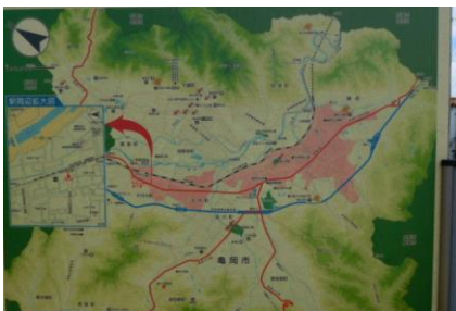
保津峡駅が踏破できないと判明