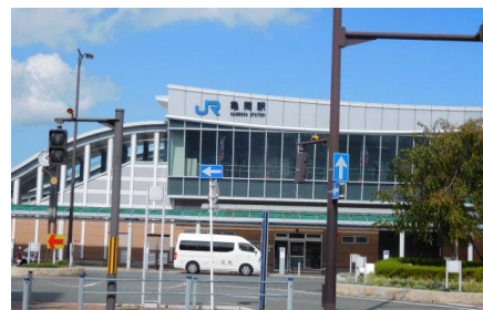
亀岡駅への路 亀岡駅

13時24分、亀岡駅に到着。本日の中では一番大きい駅舎だった。ここから、鉄道に沿ったくねくねした道路を進む。馬堀駅には14時6分到着。ここで念のため、女性の駅員さんに嵯峨嵐山への道筋を尋ねる。予想通り、国道9号線からの回り道しかないとのことであった。歩けば4~5時間位かかるとのこと、この駅で今回の歩きは上がりとする。馬堀駅14時19分の電車で京都に向かう。この駅の近くにはトロッコ亀岡駅があった。京都から15時33分発のひかりで自宅へ。自宅には19時20分到着。本日の営業キロは16.1km、万歩計は35,853歩であった。これで通算営業キロは、8,301.5km(活動回数417回)となった。後1km歩けば日本の鉄道の3割を達成する。充実した2日間であった。