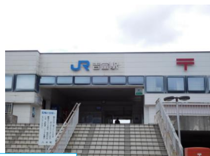
吉富駅への路 吉富駅